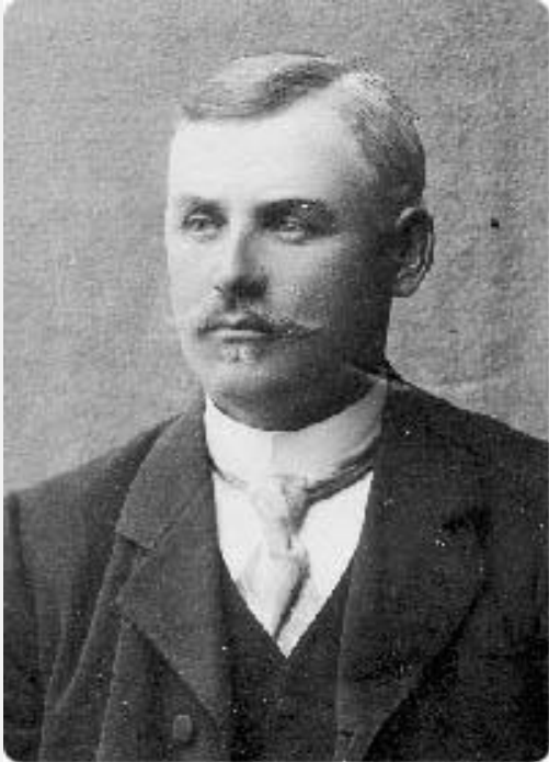
År 1907 började Carlsson som stuvare i Sikeå, sedan den där en tid verkande kooperativa stuveriföreningen